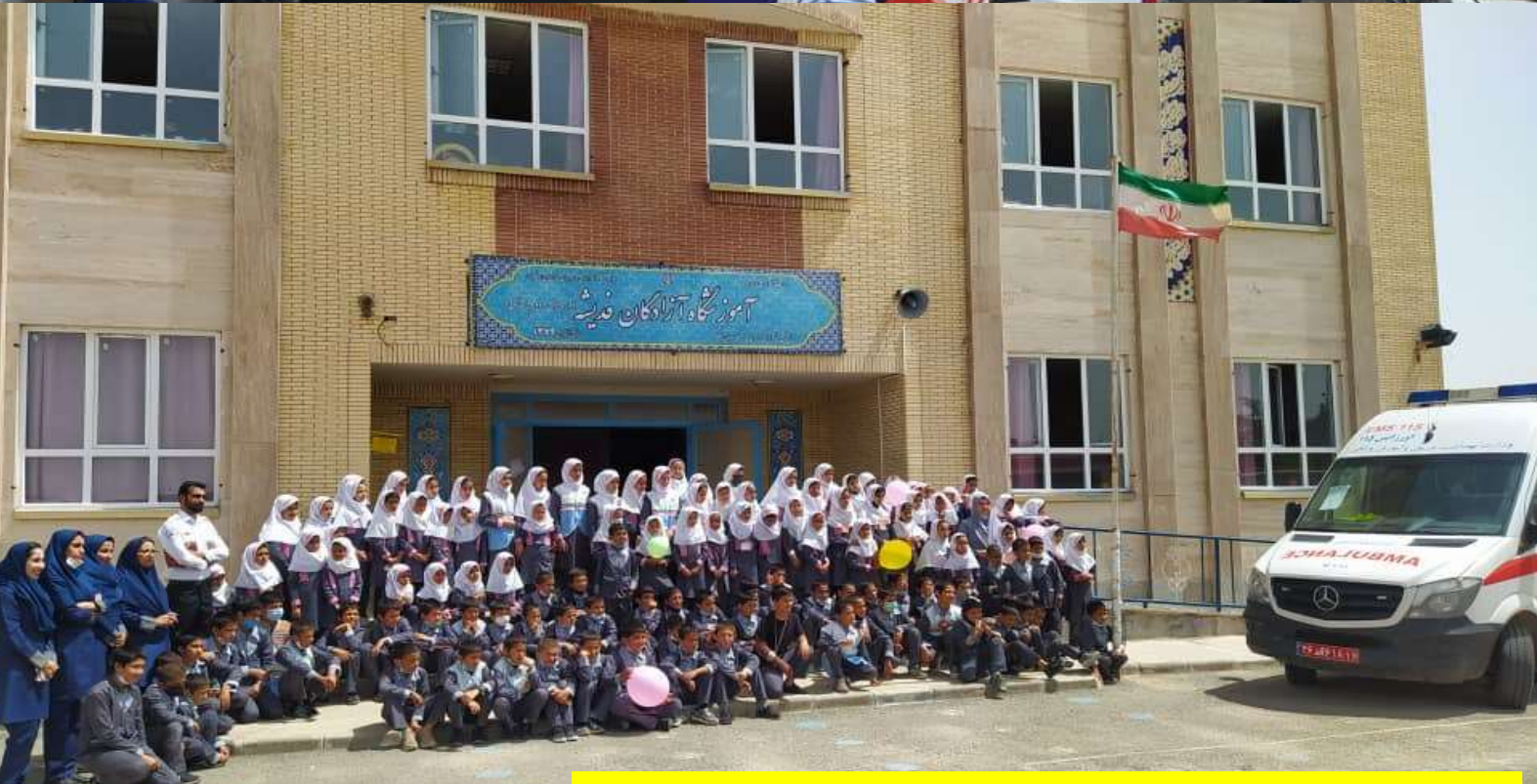
آموزش بیش از چهارده هزار دانش آموز در هشتاد مدرسه نیشابور