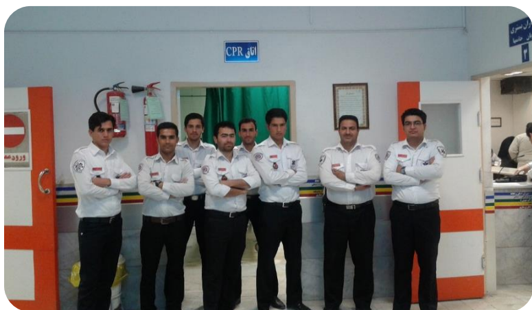
کارآموزی در عرصه دانشجویان فوریت پزشکی ورودی ۹۲