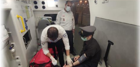
ویژه کلیه همکاران محترم (سادی، عملیاتی و ارتباطات)