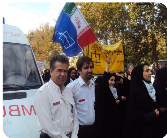
استقرار روز قدس سال ۹۲