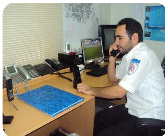
مرکز ارتباطات سال ۹۲