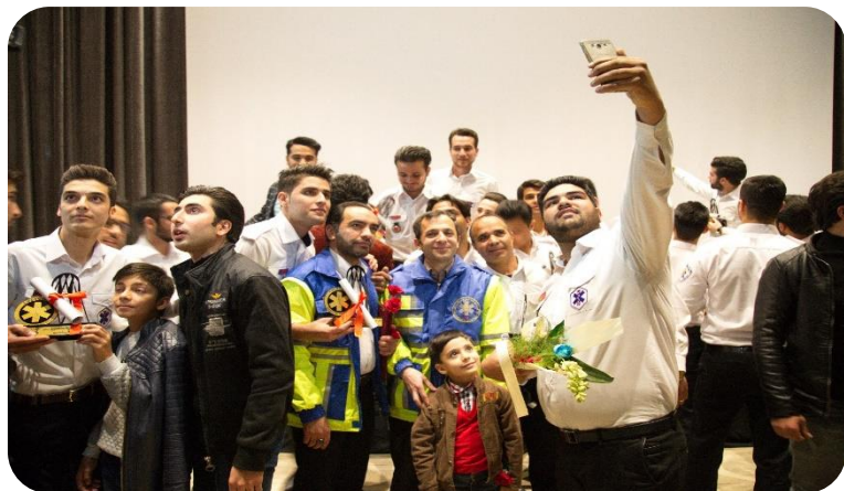
جشن فارغ التحصیلی دانشجویان ورودی ۹۳